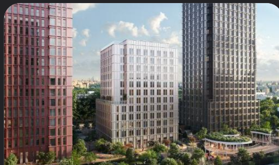
ЖК Среда на Кутузовском