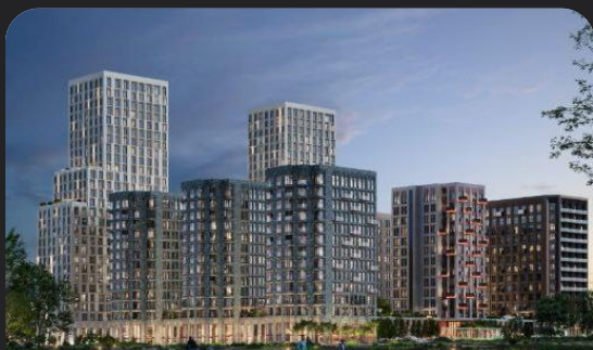
ЖК Среда на Лобачевского